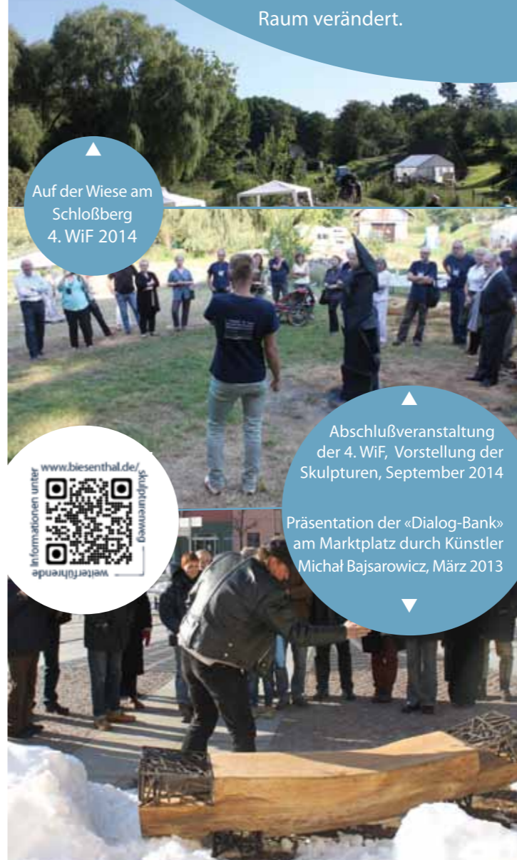
Auf der Wiese am Schloßberg 4. WiF 2014

Seit März 2015 werden die Skulpturen der 4. WiF 2014 im Stadtbild präsentiert und verbleiben dort für zwei Jahre als Leihgabe der Künstler. Wir laden Sie ein, durch Biesenthal zu spazieren und diese Skulpturen zu entdecken. Machen Sie sich selbst ein Bild, wie die Bildhauer das vorgegebene Thema 'Stadt im Wandel' umgesetzt haben und wie das Kunstwerk den öffentlichen Raum verändert.